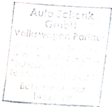
Stempel des Volkswagen Nutzfahrzeuge Partners