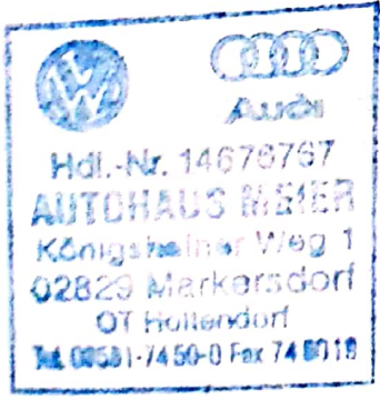
Stempel des Volkswagen Partners

LongLife Mobilitätsgarantie: Mobilitätsgarantie bis 09.2014 14678787