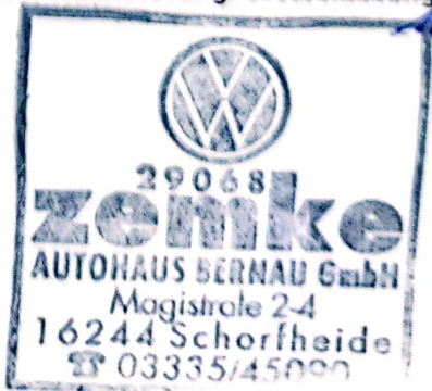
Stempel des Volkswagen Partners