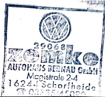
Stempel des Volkswagen Partners