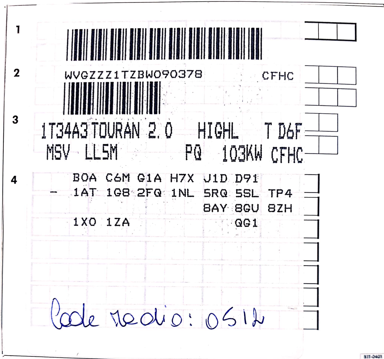
fig. 1 Plaque d'identification du véhicule